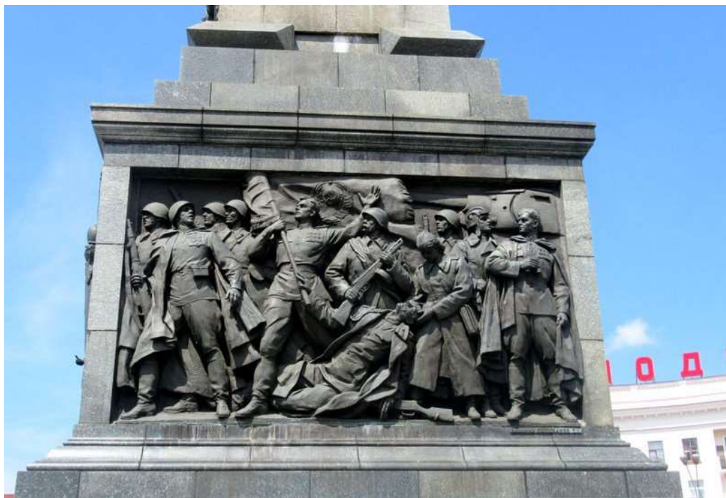
Композиция «9 мая 1945 года» (автор – белорусский скульптор А.О.Бембель)