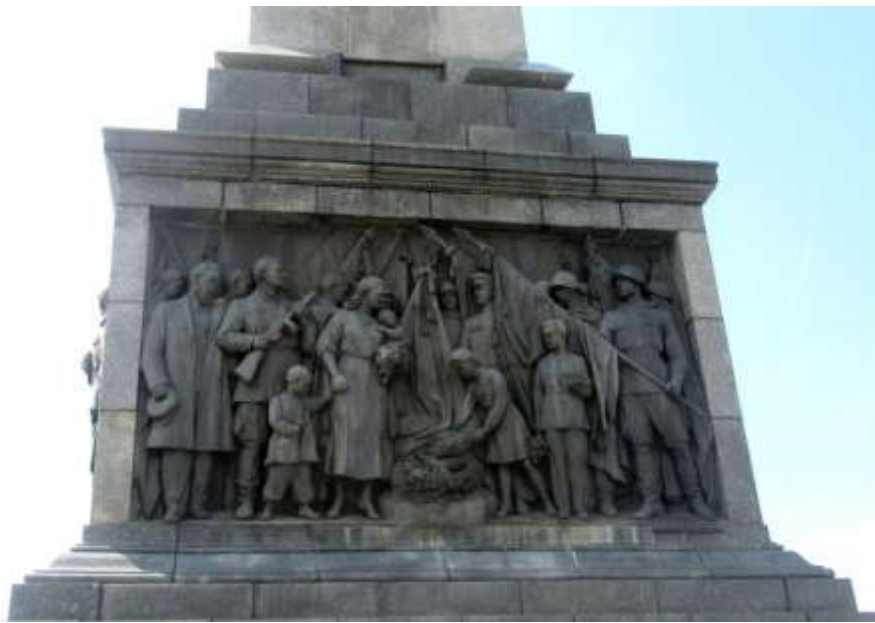
«Партизаны Беларуси» (автор - белорусский скульптор А.К.Глебов)