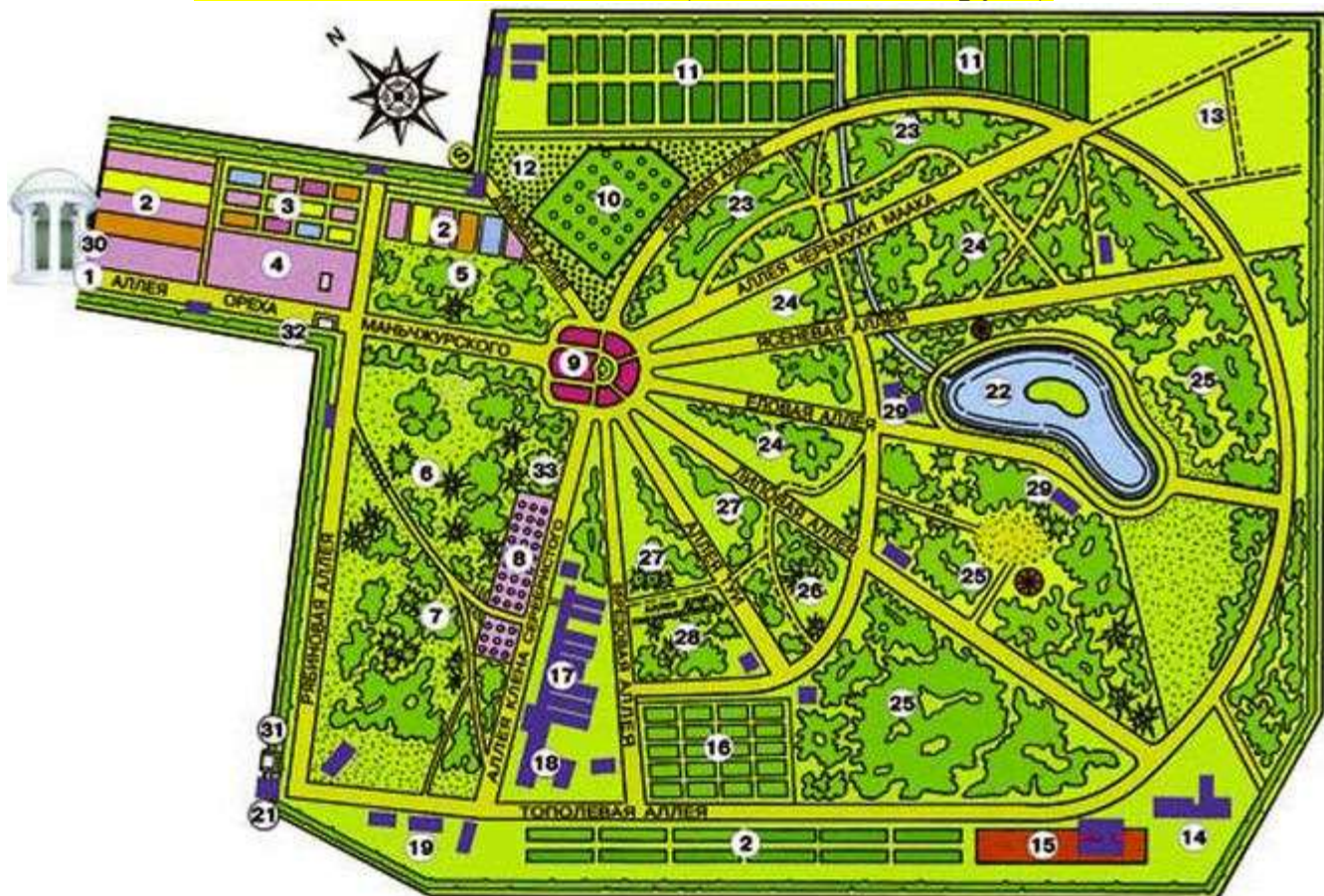
Схема ботанического сада (г. Минск, Беларусь)